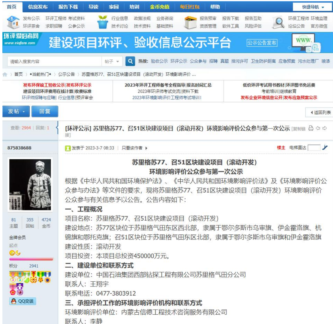
图 2.1-1 一次公示截图