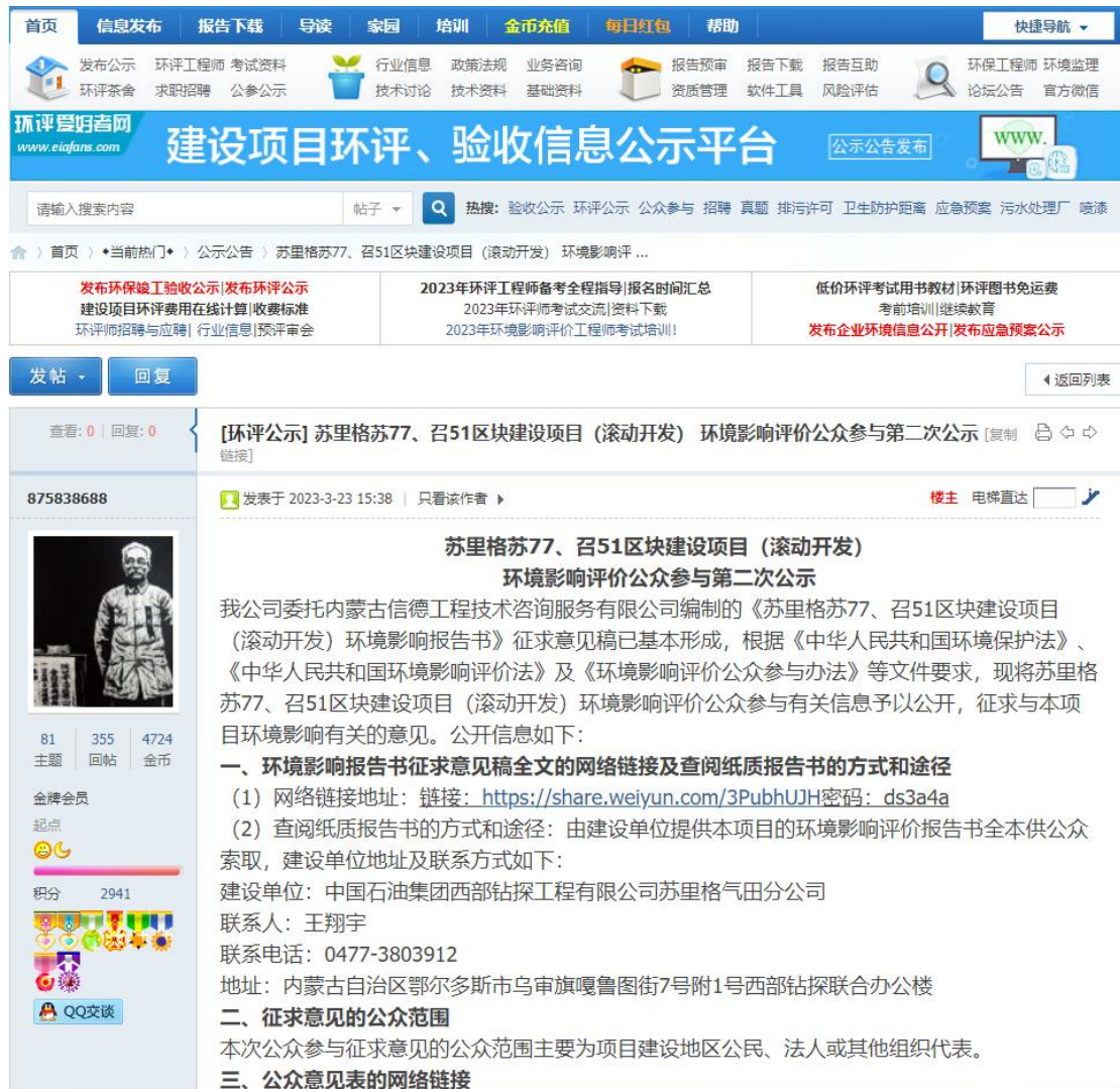
图 3.2-1 二次网络公示截图