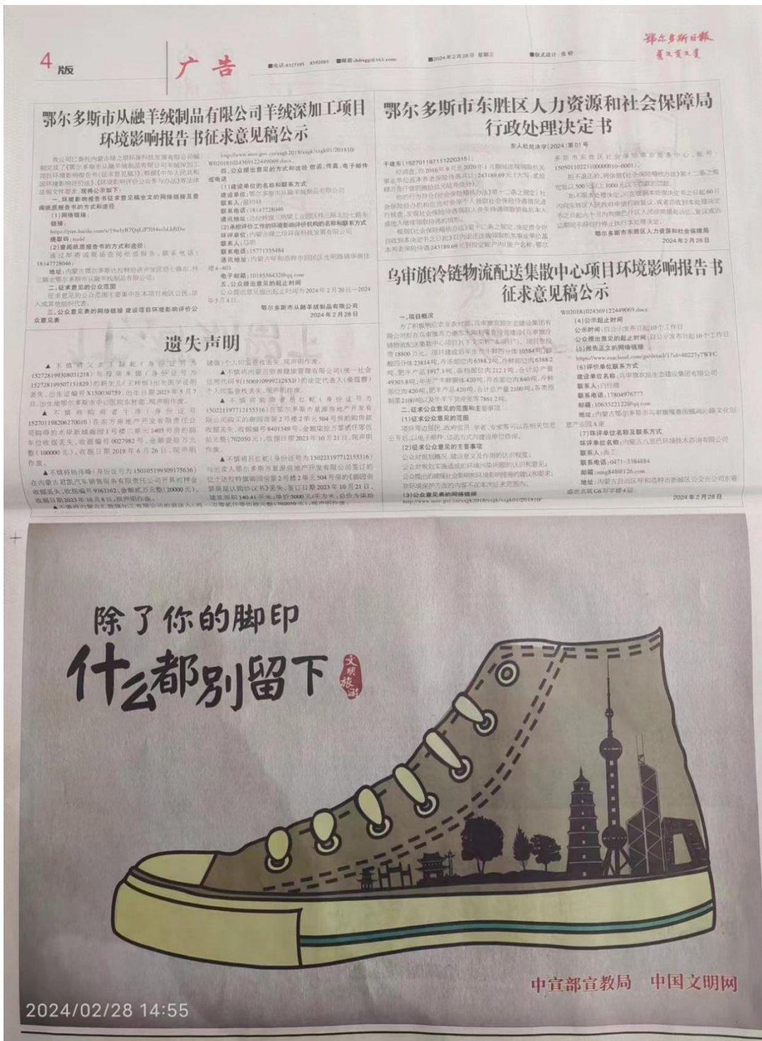
图 3.2-3 征求意见稿报纸公开情况 (第 2 次)