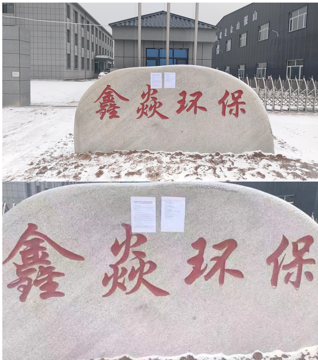
项目张贴公告照片