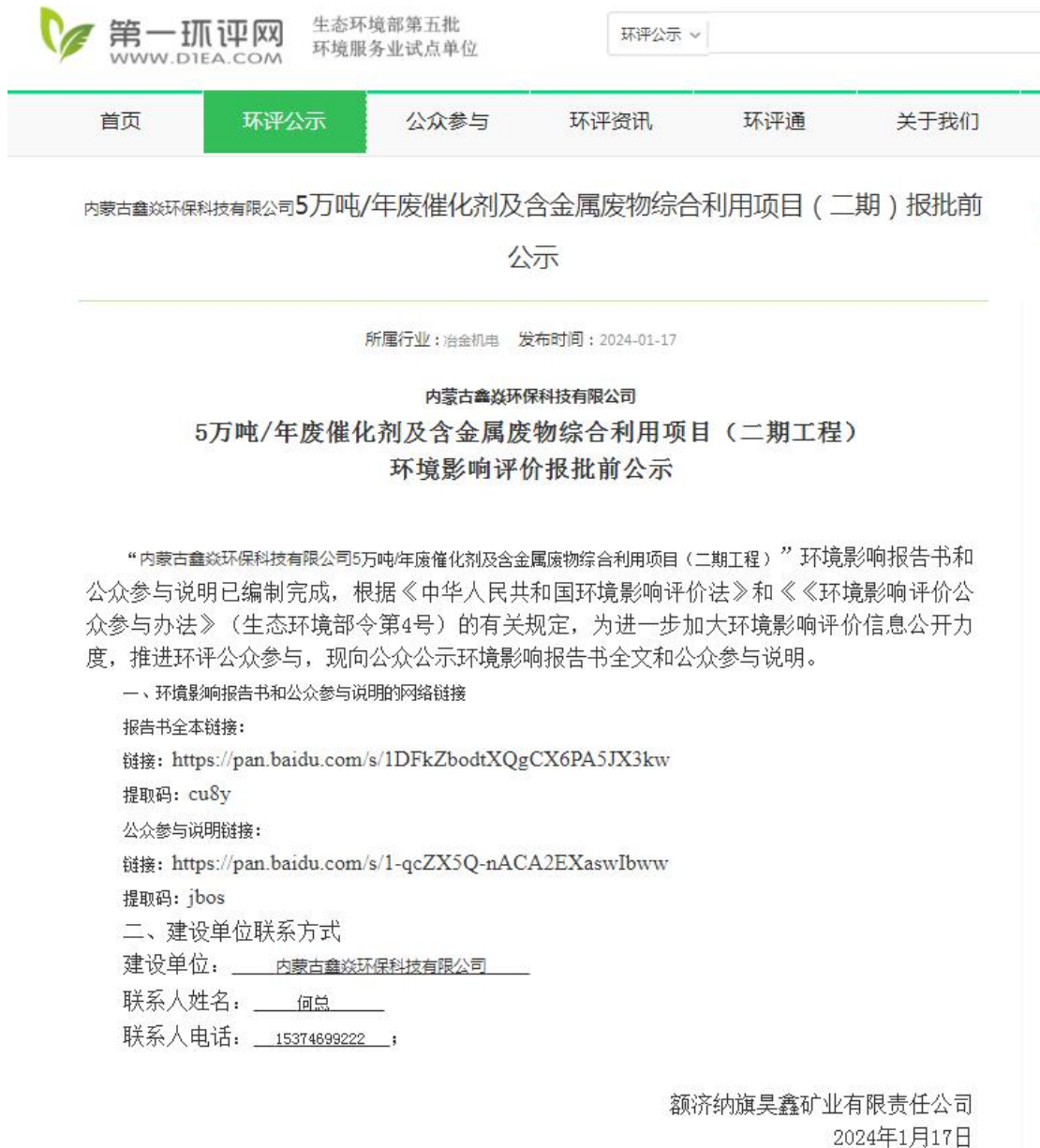
附图 5、报批前公示截图