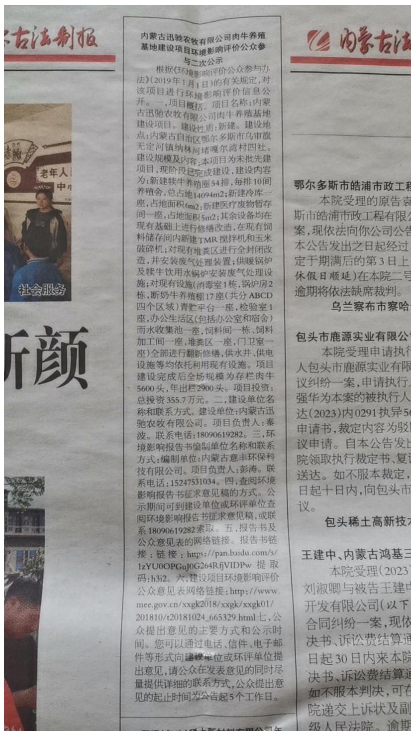
图 3.2-2 征求意见稿报纸公示一次截图

我公司分别于 2023 年 6 月 29 日和 2023 年 7 月 6 日在内蒙古法治报进行了征求意见稿两次公示。公示截图见图 3.2-3 和图 3.2-4。